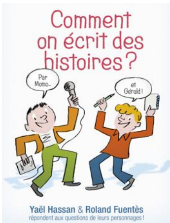
« Comment on écrit des histoires ? » aux éditions Syros, 5 €

En fait, il n'y a pas de règle... Il faut juste l'envie d'écrire, un stylo, un crayon (ou un ordinateur pour les plus modernes... ou les plus paresseux !). Et du travail. Très rares sont les écrivains qui se satisfont de la première version de leur histoire. Ils jouent avec les mots, les manipulent, les font rimer, s'entrechoquer, se mélanger. Le petit guide « Comment on écrit des histoires ? » est une aide précieuse pour ceux qui veulent devenir écrivain. Deux auteurs, Yaël Hassan et Roland Fuentès confient leurs trucs et astuces et proposent des exercices plutôt drôles pour s'entraîner.